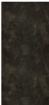
Pregled cijele ploče